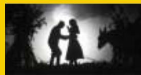
József és testvérei