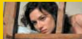
A fény ösvényei